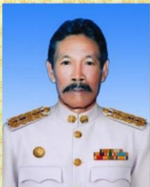
นายลิ้ม เทศนอก รองประธานสภา